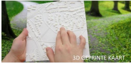
3D GEPRINTE KAART